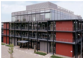
Tagungsort: WZL der RWTH Aachen

DIGITAL IN NRW KOMPETENZ FÜR DEN MITTELSTAND